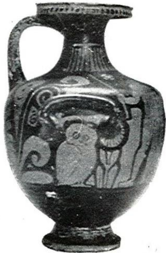
Empúries, MAC-G 790

Trias 1967-1968, p. 53-54, nº 790, lám. XIV, 4