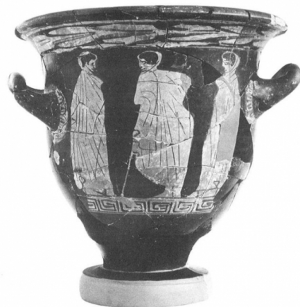
Ullastret, MAC-ULL RG SN 1 Maluquer/Picazo/Martin 1984, pl. 13, lám. 2