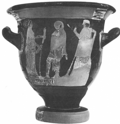
Ullastret, MAC-ULL RG SN 1 Maluquer/Picazo/Martin, 1984, pl. 13, lám. 1