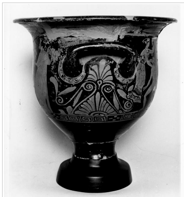
Galera, MAN 1935-4-GAL-T82-2