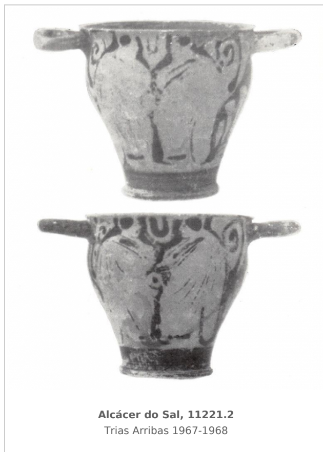
Alcácer do Sal, 11221.2 1967-1968