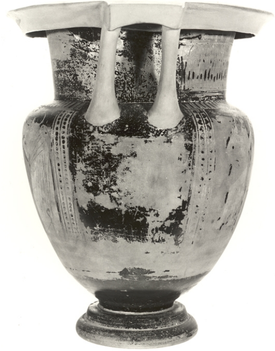
Villaricos, MAN 1935-4-VILL-T39-1