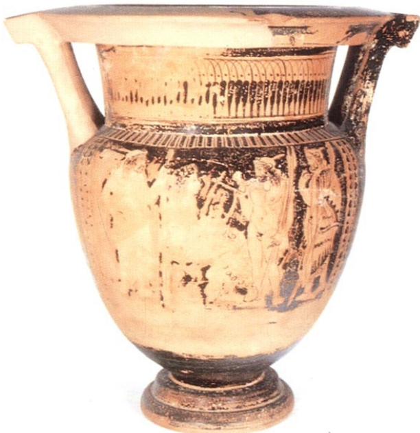
Villaricos, MAN 1935-4-VILL-T39-1