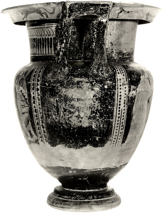
Villaricos, MAN 1935-4-VILL-T39-1