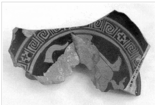
Empúries. MAC-E 11590 DE HOZ GARCÍA-BELLIDO 2014, p. 47-48, nº 9