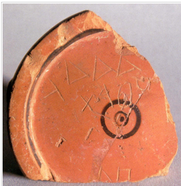
Empúries, MAC-E 3675 Museu d'Arqueologia de Catalunya-Empúries