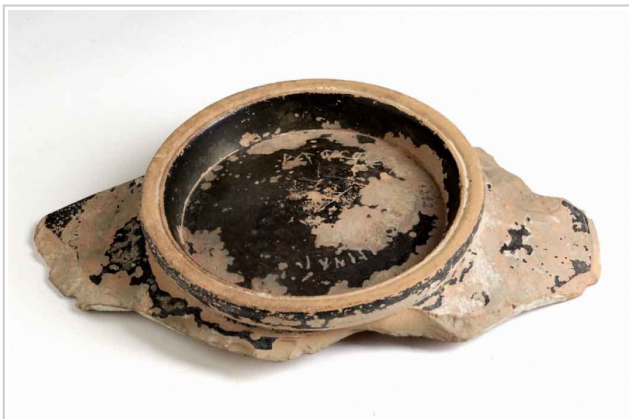
Empúries, MAC-E 2678