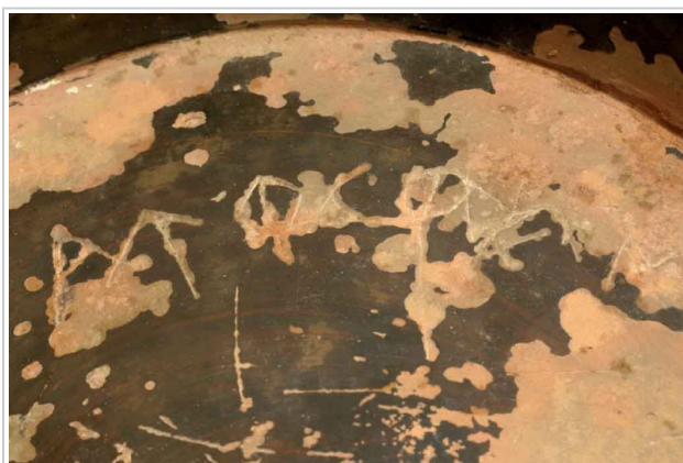
Empúries, MAC-E 2678