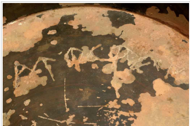
Empúries, MAC-E 2678