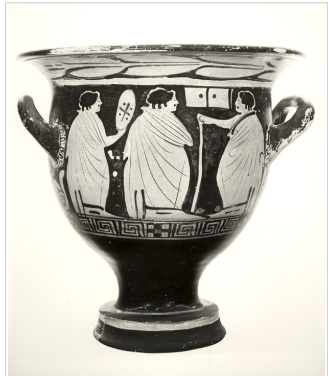
Villaricos, MAN 1935-4-VILL-T52-II-1