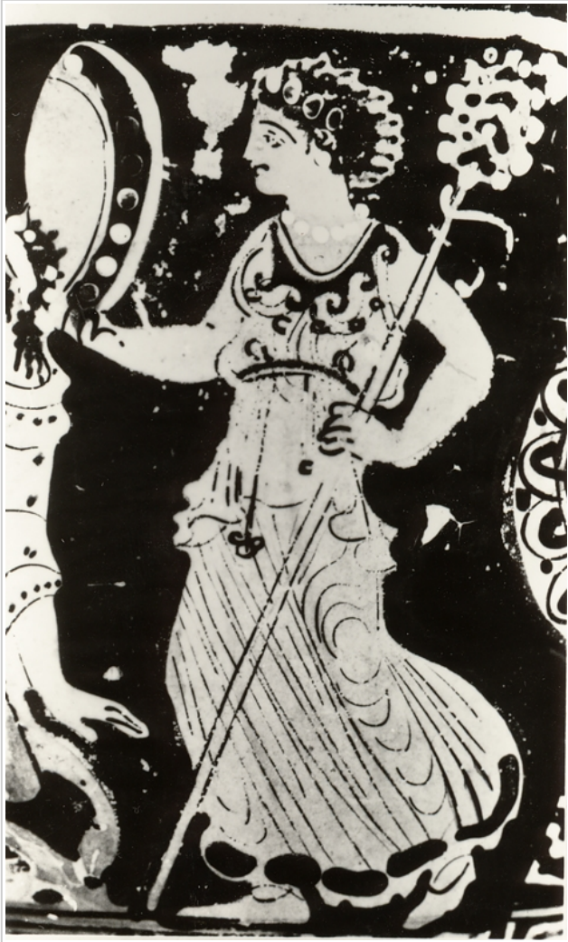
Villaricos, MAN 1935-4-VILL-T52-II-1