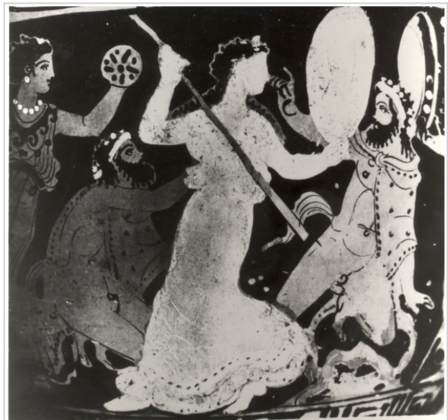
Villaricos, MAN 1935-4-VILL-T52-II-1