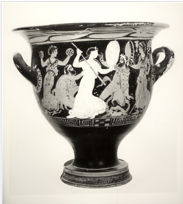
Villaricos, MAN 1935-4-VILL-T52-II-1