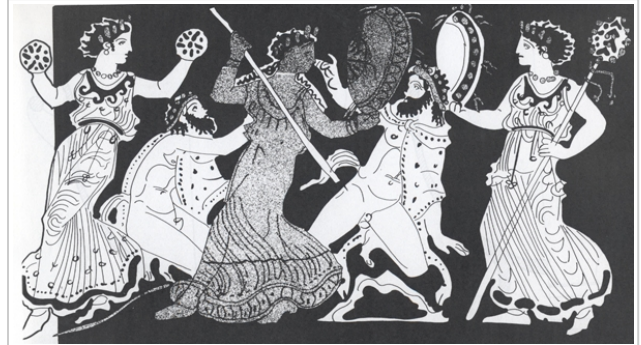
Villaricos, MAN 1935-4-VILL-T52-II-1 SÁNCHEZ 1991, fig. 3, nº 4