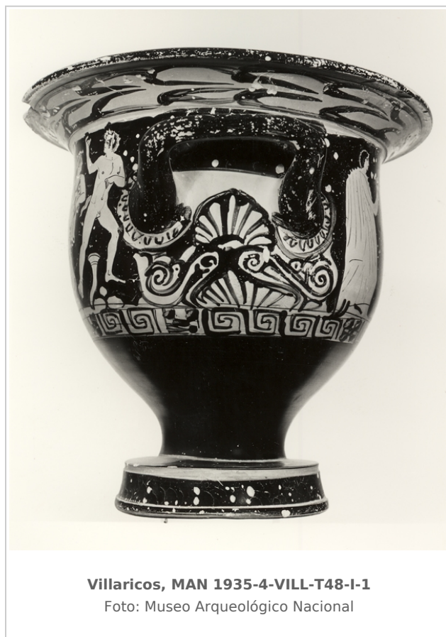
Villaricos, MAN 1935-4-VILL-T48-I-1