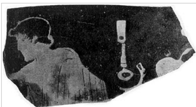
Empúries, MAC-E RG SN 82a Miró 2006