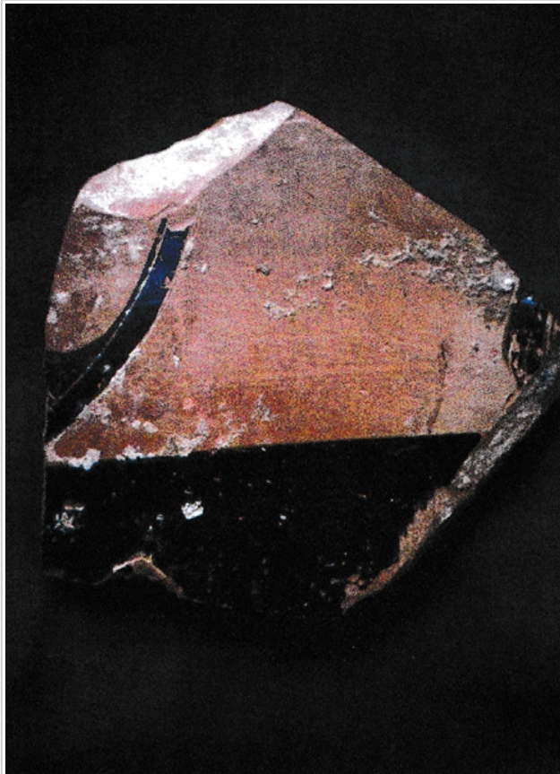
La Albufereta, MARQ NA-5979 García Martín 2004