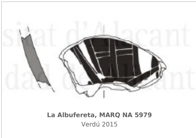
La Albufereta, MARQ NA 5979 Verdú 2015