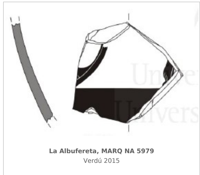
La Albufereta, MARQ NA 5979 Verdú 2015