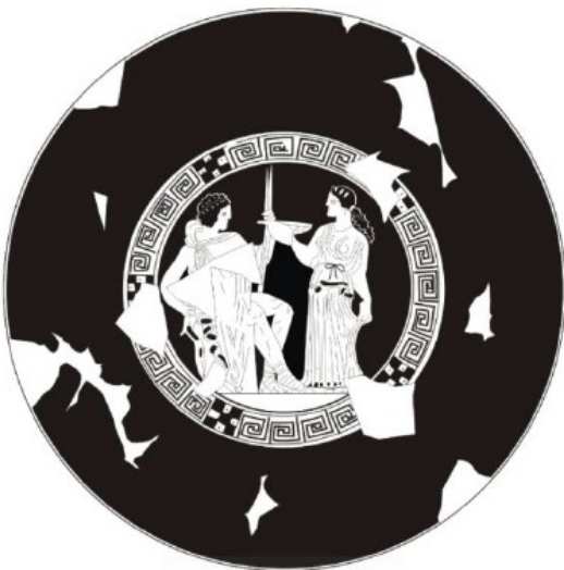
La Albufereta, MARQ NA-6024 Verdú 2015