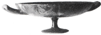
La Albufereta, MARQ NA-6024 Rubio Gomis 1986