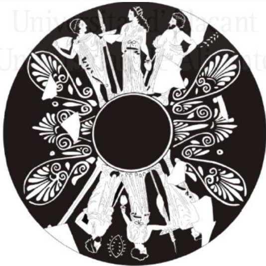
La Albufereta, MARQ NA-6024 Verdú 2015