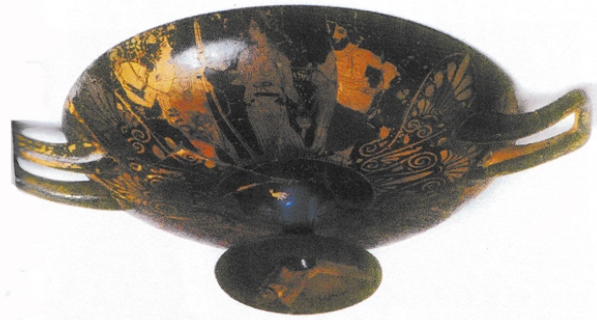
La Albufereta, MARQ NA-6024 García Martín 2004