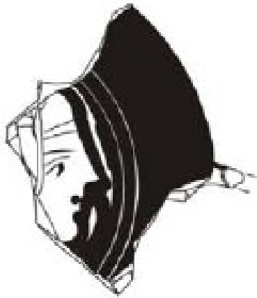
La Albufereta, MARQ NA-5973 Verdú 2015