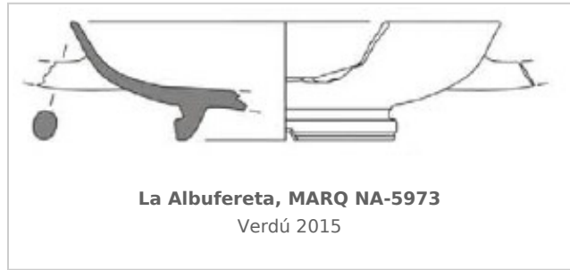
La Albufereta, MARQ NA-5973 Verdú 2015