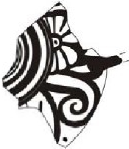
La Albufereta, MARQ NA-5973 Verdú 2015