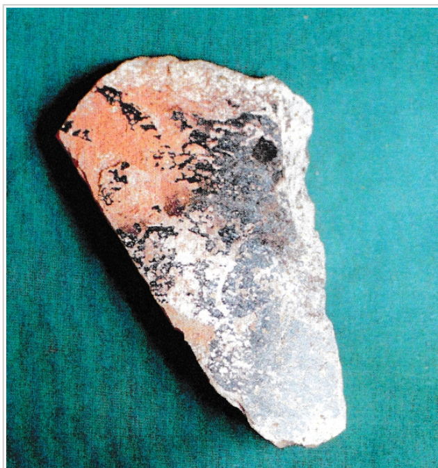
La Illeta dels Banyets, MARQ IC-76-287 García Martín 2004