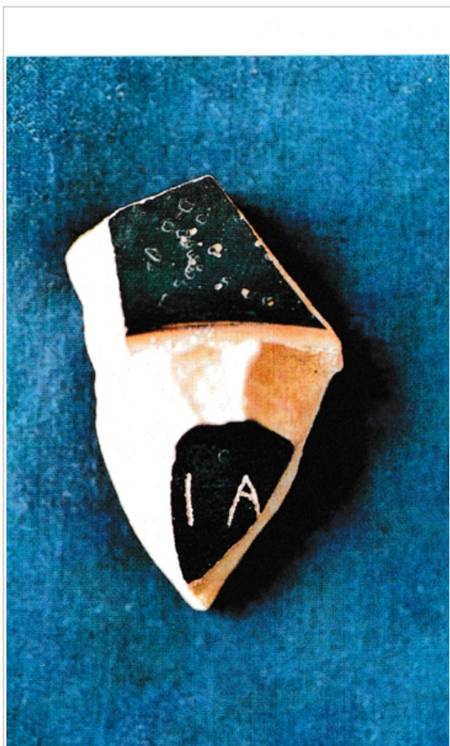
La Illeta dels Banyets, MARQ IC-74-23 García Martín 2004