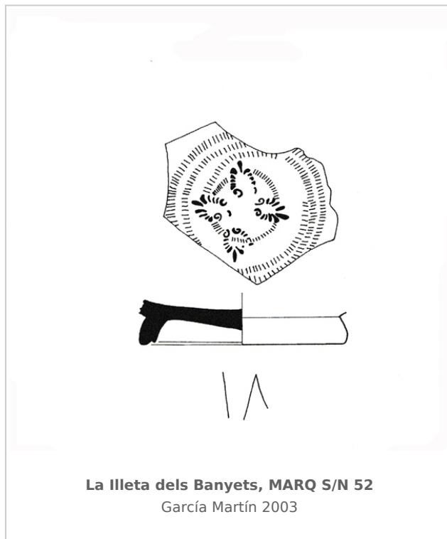
La Illeta dels Banyets, MARQ S/N 52 García Martín 2003