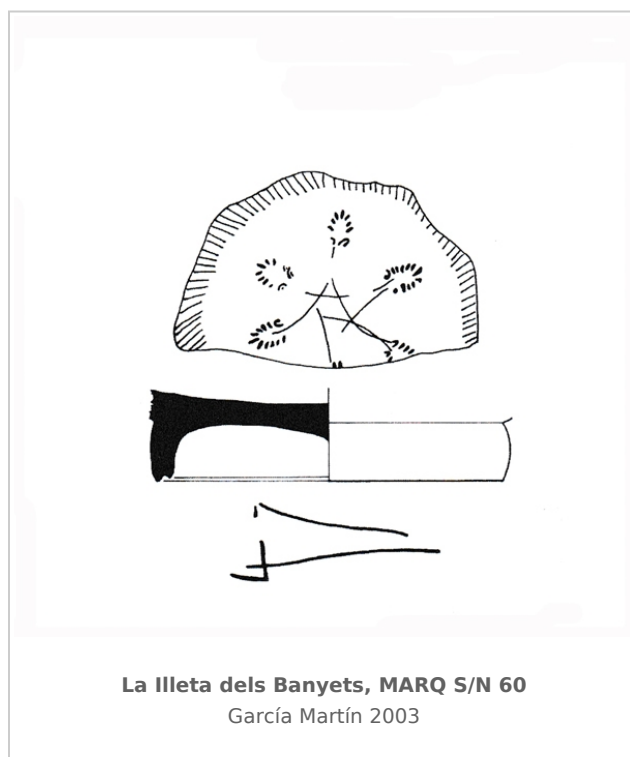
La Illeta dels Banyets, MARQ S/N 60 García Martín 2003