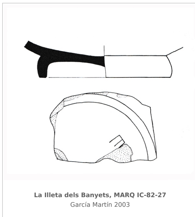
La Illeta dels Banyets, MARQ IC-82-27 García Martín 2003