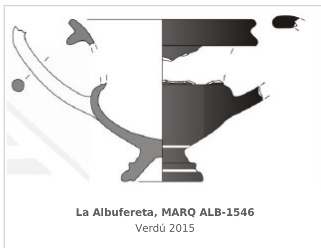
La Albufereta, MARQ ALB-1546 Verdú 2015