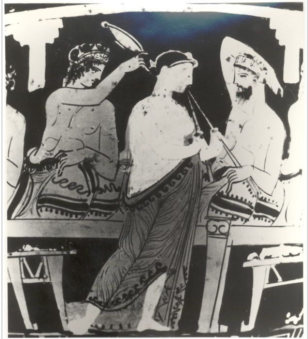
Baza, MAN 1969-68-28