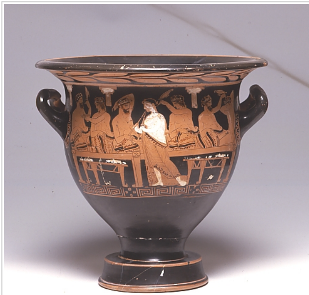
Baza, MAN 1969-68-28