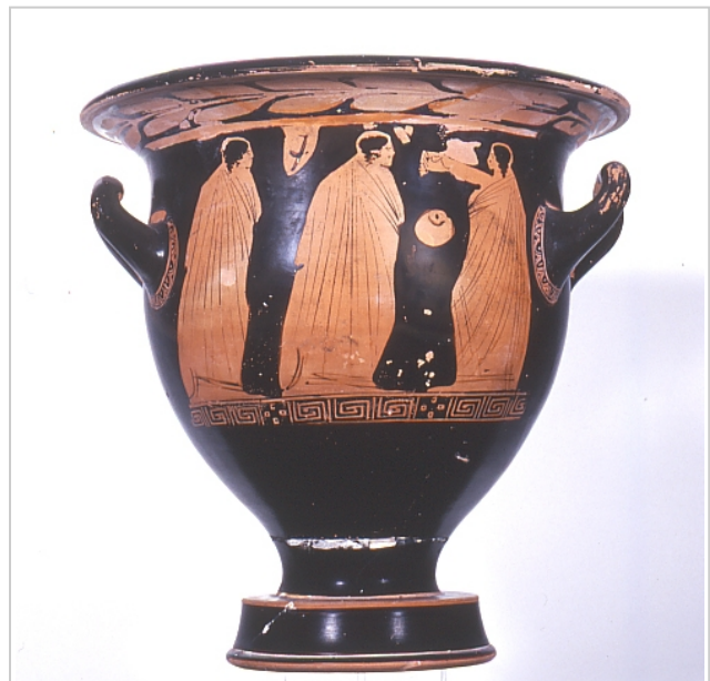
Baza, MAN 1969-68-28