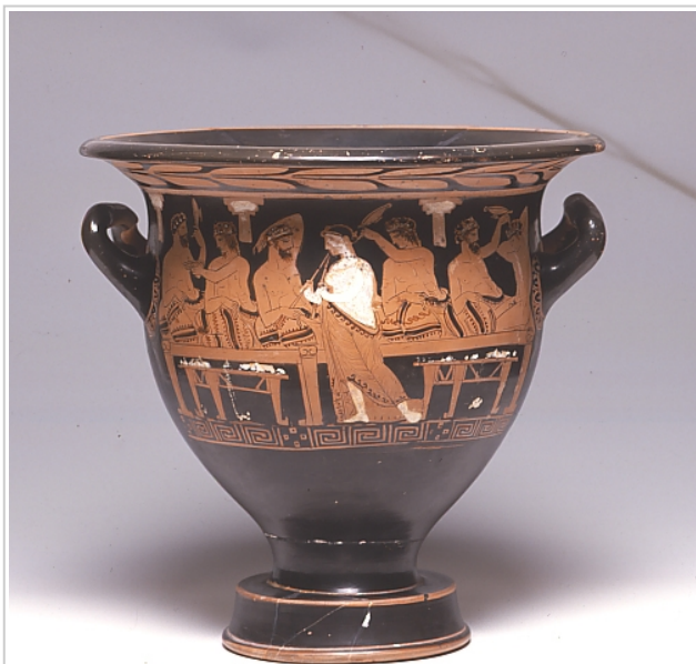
Baza, MAN 1969-68-28