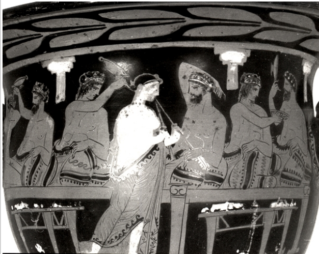
Baza, MAN 1969-68-28