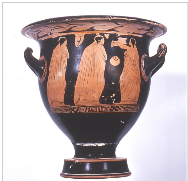
Baza, MAN 1969-68-28