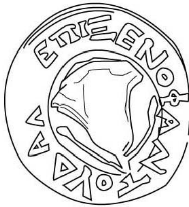
Empúries, MAC-E RG SN 131 TREMOLÉDA, J., SANTOS, M. 2013