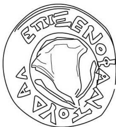
Empúries, MAC-E RG SN 131 TREMOLEDA, J., SANTOS, M. 2013