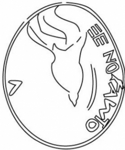
Empúries, MAC-E 11568 TREMOLÉDA, J., SANTOS, M. 2013