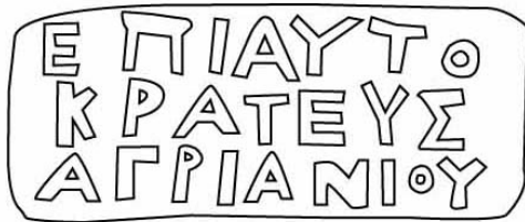
Empúries, MAC-B 1673 TREMOLEDA, J., SANTOS, M. 2013