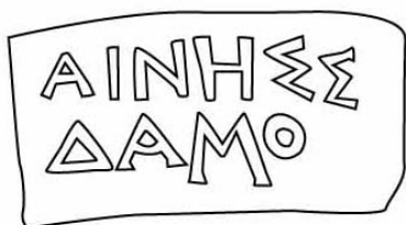
Empúries, MAC-E 1108 TREMOLEDA, J., SANTOS, M. 2013