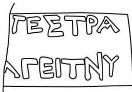
Empúries, MAC-E 11.579 TREMOLEDA, J., SANTOS, M. 2013