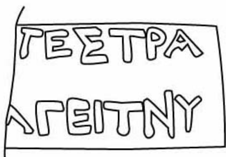
Empúries, MAC-E 11.579 TREMOLÉDA, J., SANTOS, M. 2013