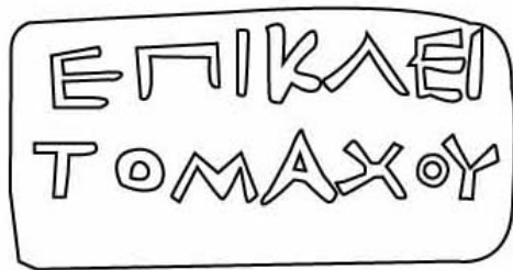
Empúries, MAC-E 11.569 TREMOLEDA, J., SANTOS, M. 2013