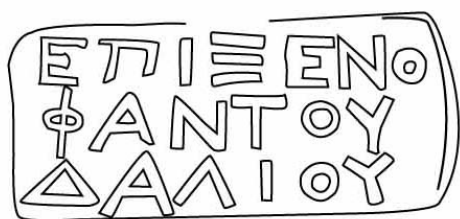
Empúries, MAC-E 11.570 TREMOLEDA, J., SANTOS, M. 2013