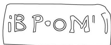
Empúries, MAC-E 1088 TREMOLEDA, J., SANTOS, M. 2013